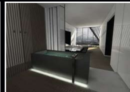
プライベートシャレー(ヴィラ)