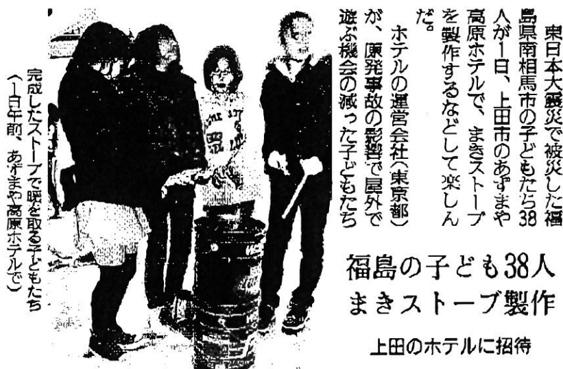
完成したストーブで暖を取る子どもたち （1日午前、あずまや高原ホテルで）

東日本大震災で被災した福島県南相馬市の子どもたち38人が1日、上田市のあずまや高原ホテルで、まきストーブを製作するなどして楽しんだ。